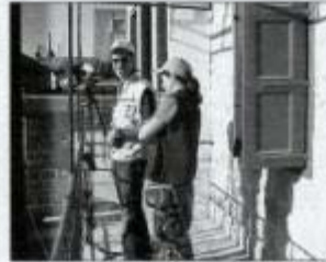
هادي زكاك في مرجعون

"غير وجهتك وانطلق جنوباً" عنوان شريط وثائقي من نحو ثلاثين دقيقة للمخرج هادي زكاك يضاف الى أرشيفه الذي يصنعه بشغف المكتشف و"السائح" في وطنه كما يقول. "حاصبيا ومرجعون" قضاءان في أقصى الجنوب اللبناني ناساً تحت نهر الاحتلال الاسرائيلي لأكثر من عقدين من الزمن، لكن الفيلم ليس تأريخاً لتلك الحقبة بقدر ما هو صورة حية عن مواطنين يعيشون وسط الطبيعة التي لم يفزها العمران وظلت وهبة لآثارها وتاريخها وحضارتها برغم معاناة البعض أثناء الاحتلال وبعده، لكن الأهم هو البقاء بعيداً عن العداية الموحشة أحياناً. بكاميرا هادي زكاك وتعليقه بصوته، أخذنا المخرج الى حاصبيا ومرجعون في عشوار على ضفاف نهر الليطاني وجمي إيل السلي مرورا بنهر الدردارا - الخيام ومقلها. وأطل على جبل حرمون المعروف بجبل الشيخ - شيعا غير تلك المعروفة بمزارعها المحتلة، بل بلدة شيعا القريبة من المزارع. فضلا عن الخلوات ورانشيا الفخار وسوق الخان وحاصبيا طبعاً وغيرها من المناطق وما تحفل به من الآثار والمعالم الحضارية. حاصبيا ومرجعون لا تزالان نسبياً بعيدتين عن إبطاع الحياة الحديثة، تحافظان على طابعهما الأصيل الذي ينقل إلينا صورة فريدة عن الحياة الجنوبية التقليدية وبيئتها