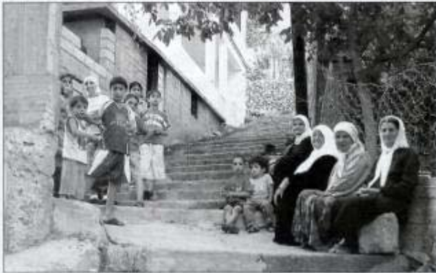
وجوه من مرجعون

الطبيعية وهذا ما أراد الفيلم إيصاله إلينا، عبر عرض للفيلم تمّ بعد ظهر الخميس 20 الجاري في قصر الأونيسكو في حضور المخرج واصحاب المشروع usaid Lebanon و mercy corps وبعض رؤساء بلديات ومخاتير وإمالي قضائي حاصبيا ومرجعون. اللافت في الفيلم هؤلاء المعمرين المتشبثون بأرضهم والمتجذرون تجذّر الشجرة بالأرض، والملاحظ شبه غياب لعنصر الشباب الذي سيجمل الأمانة في المحافظة على الأرض والرزق والعادات والتقاليد والموروثات الاجتماعية والانسانية وغيرها.