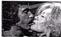
مثلة تركية من موجة الانتاج المشترك في الستينات.